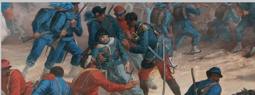
L'affresco che rappresenta l'eroica fine di Colomba Antonietti