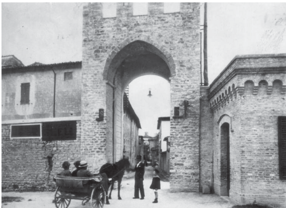
Tutti gli ingressi in città dopo la Liberazione (15 settembre 1860) erano vigilati dai soldati piemontesi e nessuno poteva entrare o uscire a piedi o in carrozza

grande famiglia italiana. Intorno alle 6 pomeridiane del 28 settembre il suono delle campane del Civico Palazzo e della Cattedrale annunciano che la fortezza di Ancona si è arresa senza condizioni. La gente scende nelle vie e nelle piazze e ancora tanti evviva all'indirizzo del Re e dell'esercito. Il 6 ottobre la città è