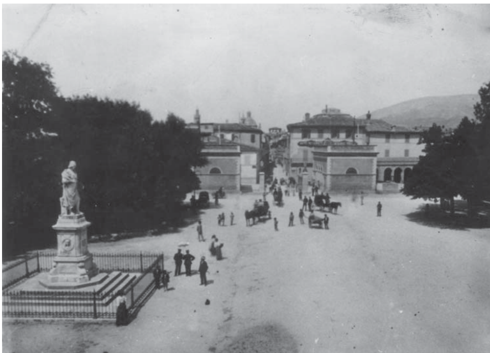
Nella zona di Porta Romana presero posto i carri della Sussistenza

di tutti i conventi, monasteri e collegiate. La decisione è generalmente poco bene accolta in quanto nessuna delle altre regioni ha emanato lo stesso decreto. In Umbria sacerdoti e monache hanno quaranta giorni di tempo per uscire dai rispettivi luoghi religiosi. Il 15 dicembre vengono nominati gli assessori comunali e il 16 la Guardia nazionale giura fedeltà al Re nella soppressa chie-