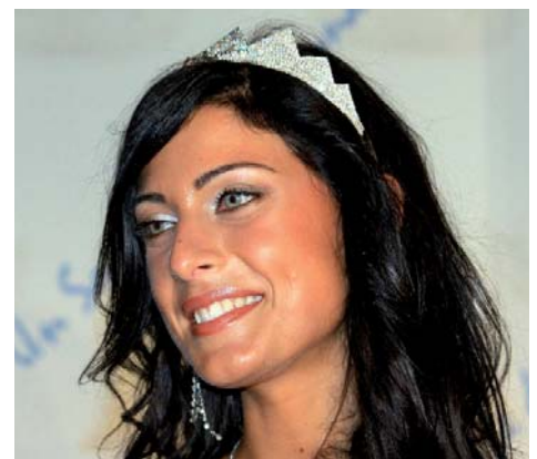
Francesca Testasecca, Miss Italia 2010