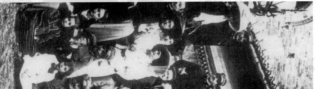
In copertina Gita della Pro loco di Foligno all'abbazia di Sassovivo, 1904. Foligno Archivio a Grondona